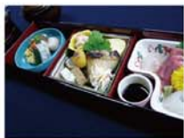
京都の老舗仕出し処 「二和伝」より

※【午前の部】、【午後の部】通して参加の場合、参加費が4,500円になります。 ※申し込みは、①参加部門②氏名③連絡先(住所、電話、FAX、メール)を明記の上、電話、FAX、メールにてお申し込ください。 ※締切11/11(木)必着(締切日以降にキャンセルされた場合は、参加費を頂きます。)