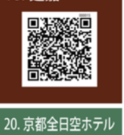
20. 京都全日空ホテル