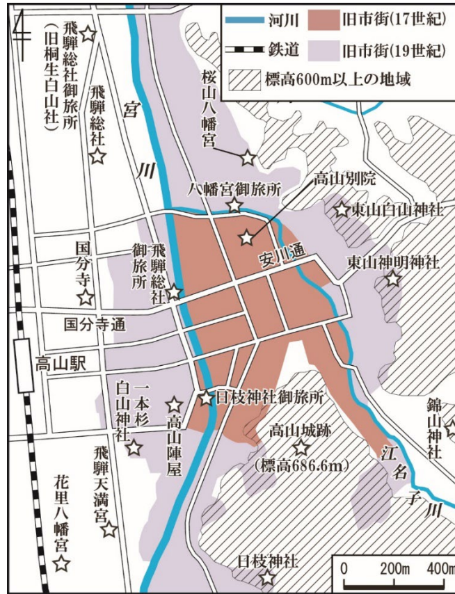
第1図 高山の地域概観図