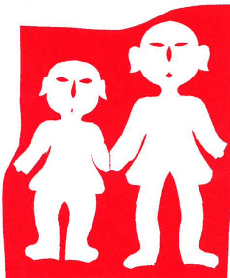
「招魂娃娃」、甘肃省庆阳县