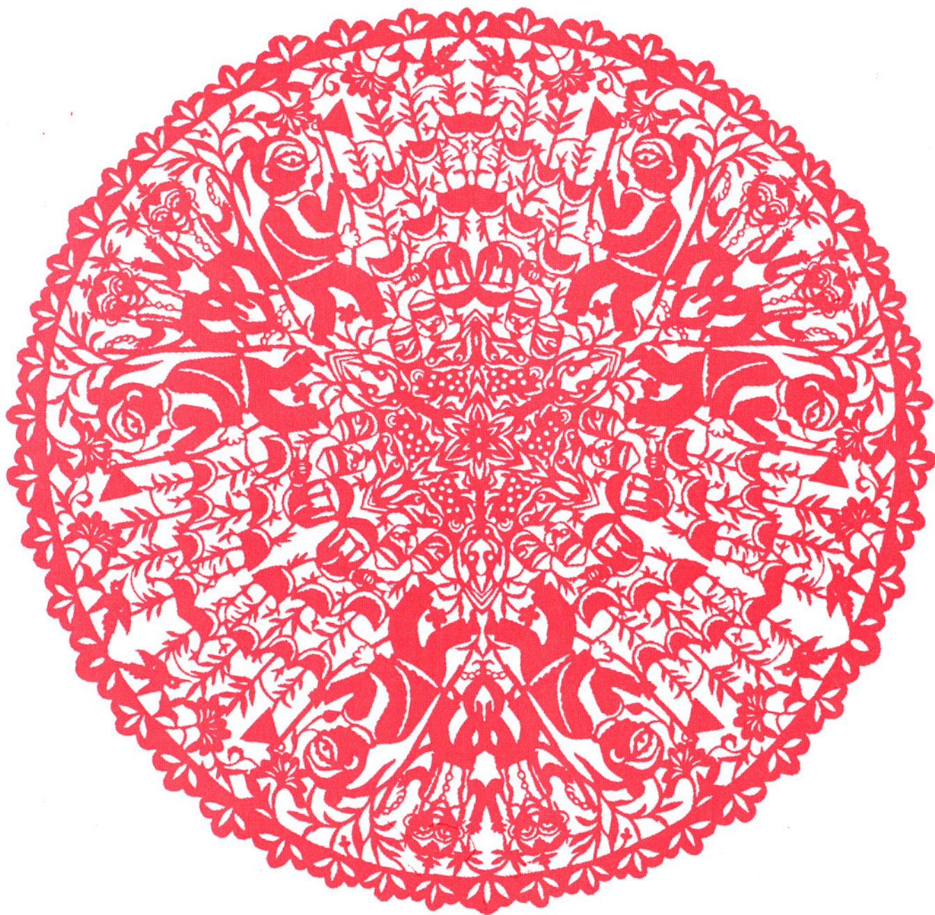
「团花」、現代的作品、陝西省延川縣小程村