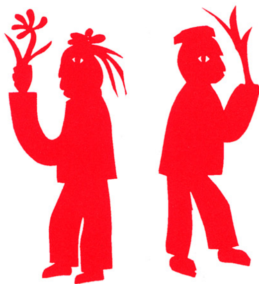
「招魂娃娃」、新疆省石河子