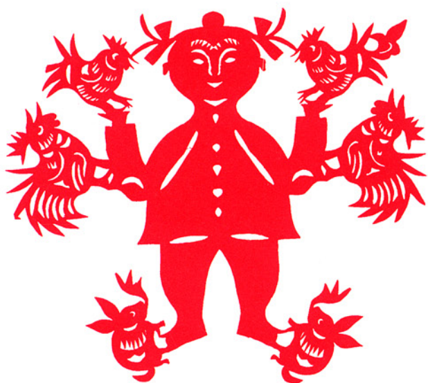
「抓髻娃娃」、陕西省安塞县