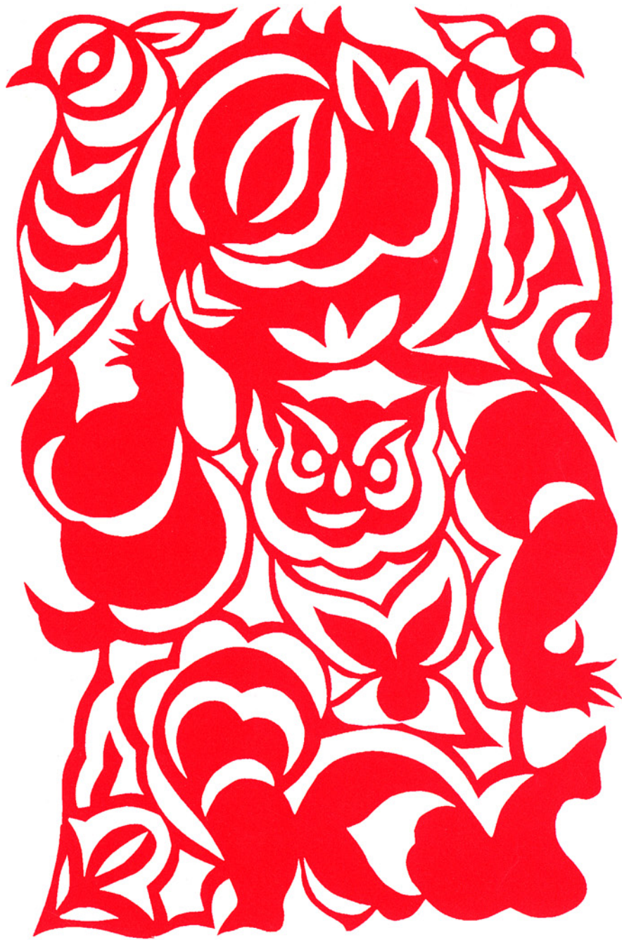
複雑なモチーフを組みこんだ高鳳蓮作品(原寸大)