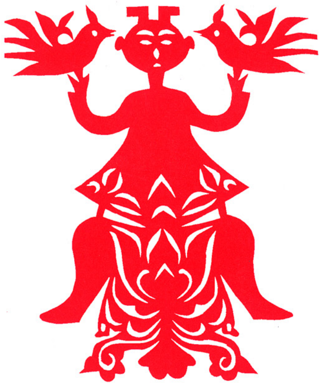
「抓髻娃娃蓮花盆」、陝西省安塞縣