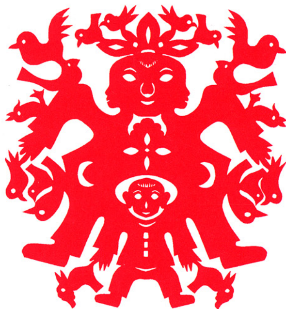
「喜娃娃」、甘肅省慶陽縣