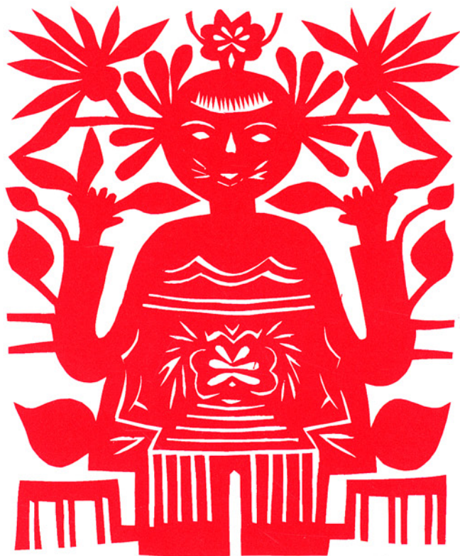
「繁衍多子の蓮花娃娃」、陝西省延長縣