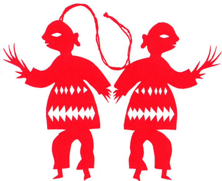
「掃天婆」、甘肃省環县