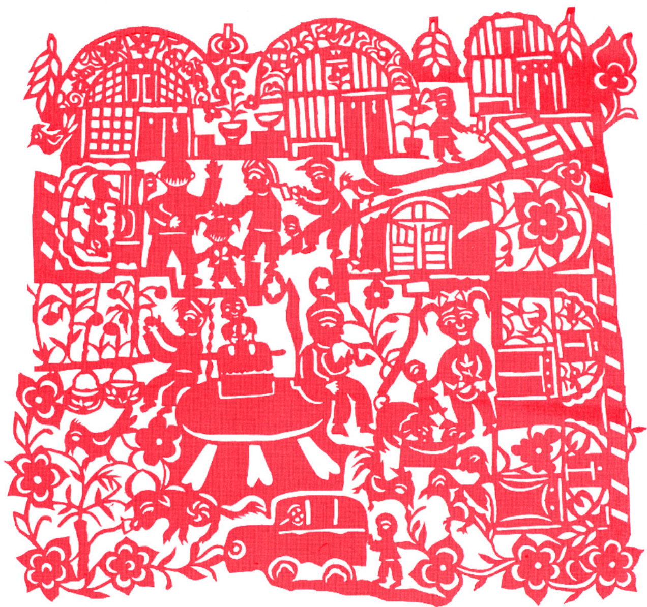
窑洞の村の生活を描いた現代的作品、陕西省延川县小程村