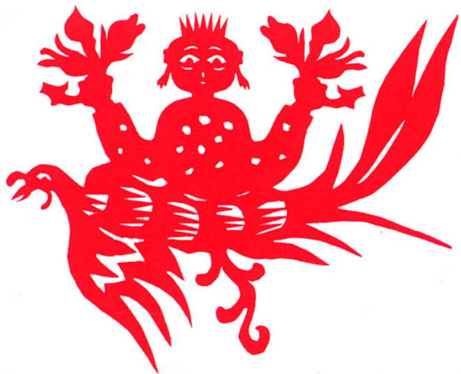
「招魂娃娃」、陕西省千阳县