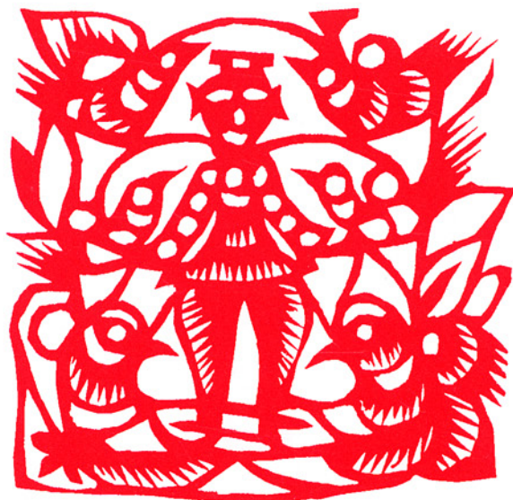
「抓髻娃娃」、陕西省安塞县