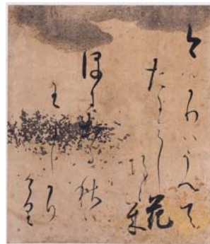
素庵《古今集和歌色紙》 17世紀