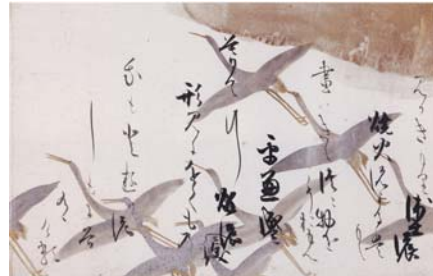
《鶴下絵和歌巻》 17世紀